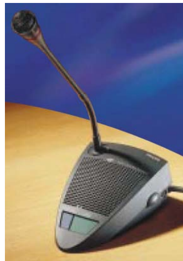
Ordstyrer kan enkelt mute alle andre enheter

Digital lyd innebærer frihet fra signalforstyrrelser, og at alle delegater får like god lyd kvalitet. Ved behov kan systemet kobles til eksterne høytalere eller lydopptaker.